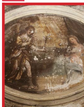
La Madonna all'inizio della scala del sotterraneo

Come ho avuto modo già di raccontare nel monastero di San Michele in Bosco vi era un teatro. Esiste ancora il locale ma è lo scheletro di un ambiente che fu adattato a teatro agli inizi del '700, e a metà dello stesso secolo fu sistemato dai famosi scenografi ed architetti teatrali i fratelli Bibbiena. Questo locale si trova nel seminterrato ed ha