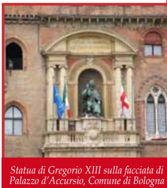
Statua di Gregorio XIII sulla facciata di Palazzo d'Accursio, Comune di Bologna

Autorizzazione del Tribunale di Bologna n. 7715 del 29 Novembre 2006