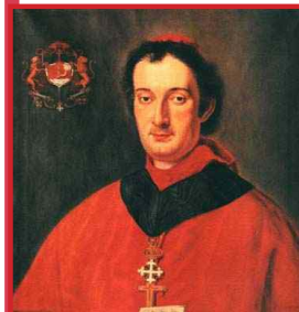
Il Cardinale Luigi Amat

Dopo il 1815 con il Congresso di Vienna, le potenze vincitrici