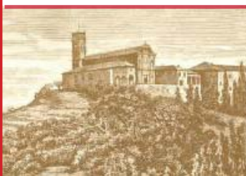
Il campanile mozzato

Papa Joseph Ratzinger, che ha annunciato il suo ritiro dal Pontificato, partecipò con una lectio magistralis nel 1988 a un convegno organizzato presso il Centro di Ricerca dell'Istituto dal Centro Enrico Manfredini.