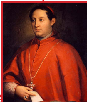
Il Cardinale Bedini

Autorizzazione del Tribunale di Bologna n. 7715 del 29 Novembre 2006