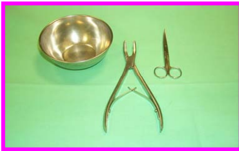
1. Tavolo attrezzato