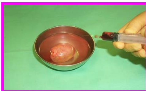
5. Eventuale aggiunta antibiotico