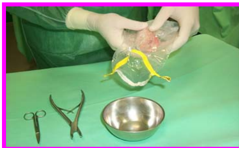
3. Apertura sacchetti sterili