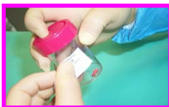
9. Etichettare i campioni culturali