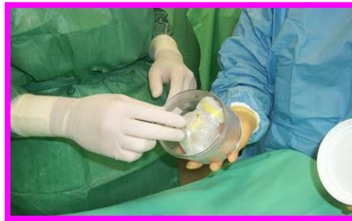
2. Apertura scatola