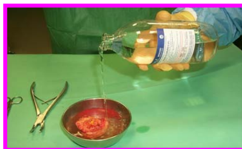
4. Bagno in sol. fisiologica sterile