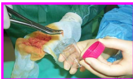
7. Frammento per colturale aerobi e miceti