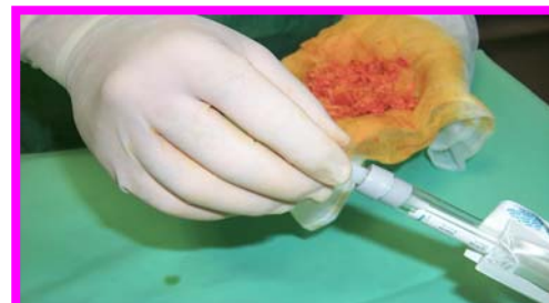
8. Tampone per colturale anaerobi