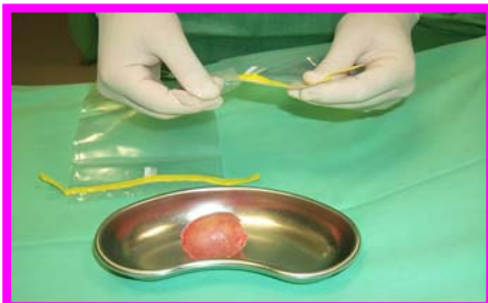
7. Aprire i sacchetti