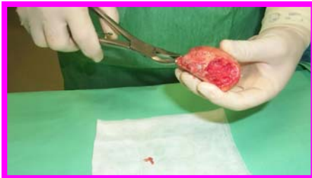
1. Rimuovere le parti molli