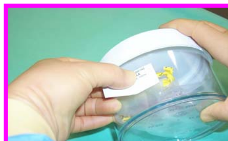
11. Etichettare il contenitore con i dati del donatore