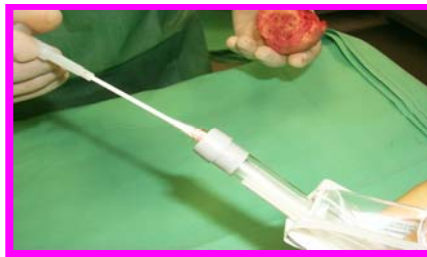
5. Inserirlo nella provetta fino in fondo