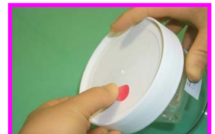
12. Etichettare con bollino rosso indicante stato di segregazione (in attesa di idoneità)