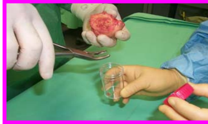
2. Prelevare un frammento per aerobi e miceti