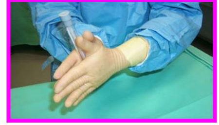
6. Agitare con movimento rotatorio, se utilizzato questo tipo di tampone per anaerobi