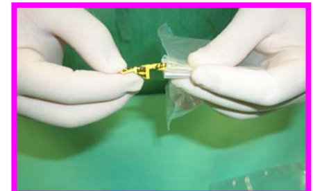
9. Attorcigliare i capi del filo metallico