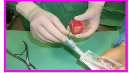
3. Estrarre il tampone per anaerobi