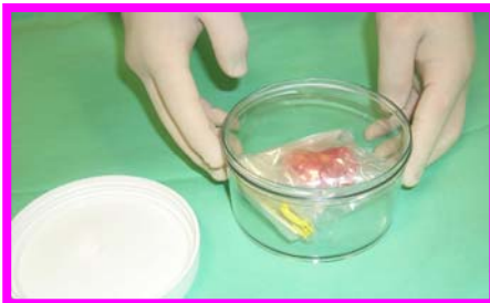
10. Inserire i 2 sacchetti con l'epifisi nel contenitore