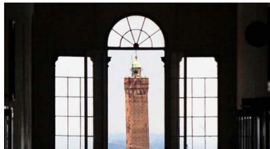
La torre degli Asinelli inquadrata dalla finestra nord del corridoio monumentale di San Michele in Bosco.

Il corridoio di 162,26 metri è uno dei vani architettonici più lunghi presenti a Bologna e la finestra nord del corridoio è esattamente in asse con l'apice della torre degli Asinelli, posta a 1407 metri di distanza. Allontanandosi dalla finestra la torre sembra percettivamente ingrandirsi. Come in uno zoom, la parte sommitale appare sempre più grande fino a coprire l'intera finestra centrale, malgrado in realtà ci si stia allontanando dalla torre. Al contrario muovendosi nel corridoio verso la tor-