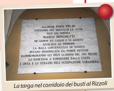
La targa nel corridoio dei busti al Rizzoli