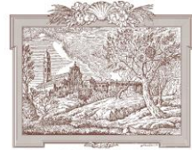
San Michele in Bosco Area Monumentale I.R.C.C.S.

SERVIZIO SANITARIO REGIONALE EMILIA-ROMAGNA Istituti Ortopedici Rizzoli di Bologna