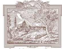
San Michele in Bosco Area Monumentale I.R.C.C.S.

SERVIZIO SANITARIO REGIONALE EMILIA-ROMAGNA Istituti Ortopedici Rizzoli di Bologna